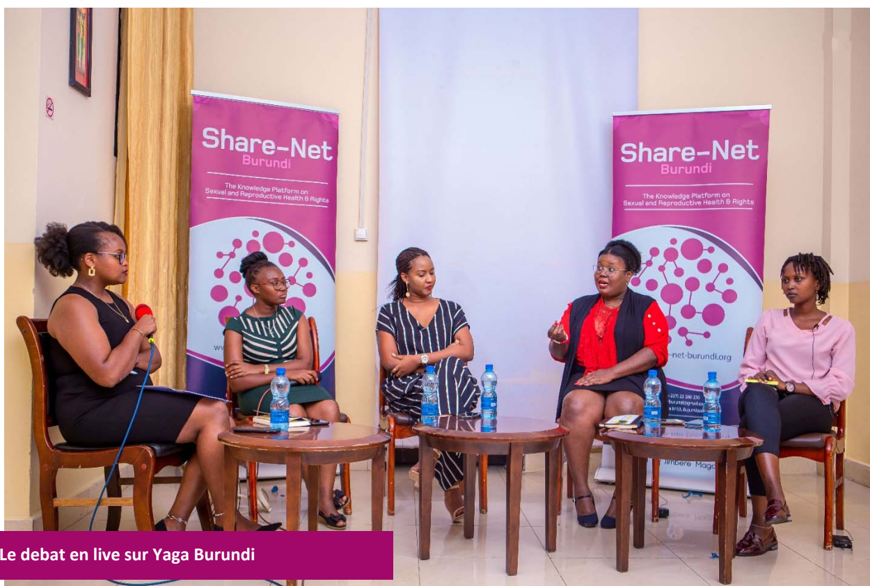
Le debat en live sur Yaga Burundi