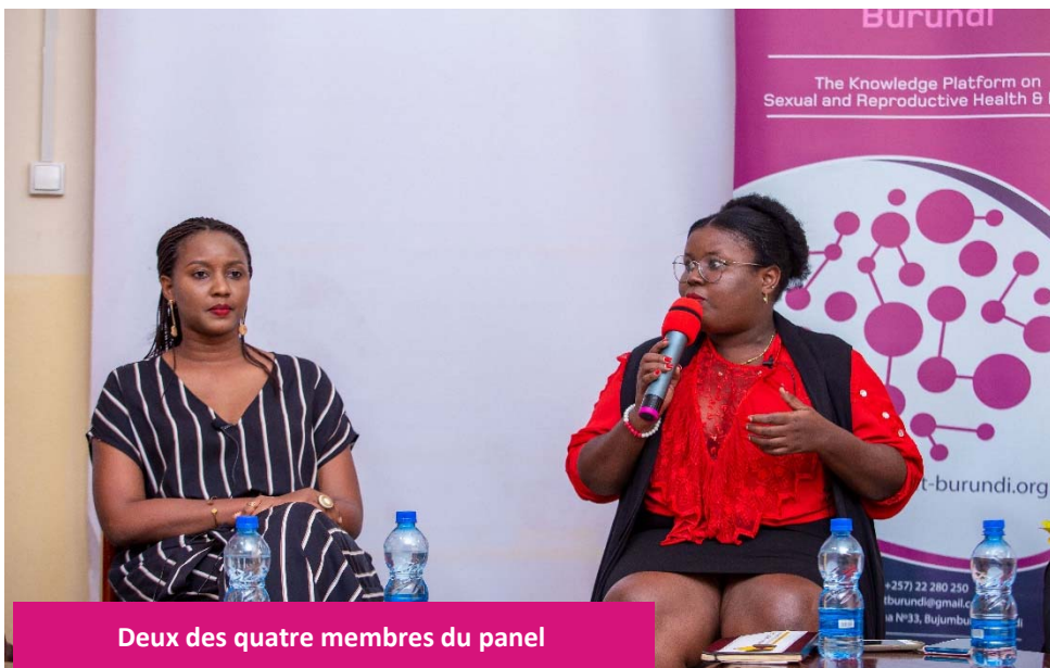
Deux des quatre membres du panel

Générer un débat autour de ce thème tabou et ainsi obtenir le soutien et l'engagement des différents acteurs et autres parties prenantes pour la promotion de la santé menstruelle au Burundi, y compris les décideurs politiques.