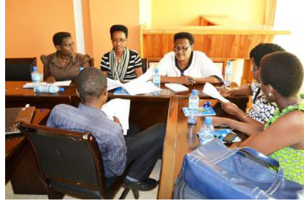
Les participants lors des travaux en groupe

Ce projet sera exécuté dans les provinces de CIBITOKÉ, BUBANZA, MURAMVYA et BUJUMBURA. Les participants composés par les coordonnateurs des Centres de Développement Familial et Communautaire (CDFC) et les directeurs des hôpitaux