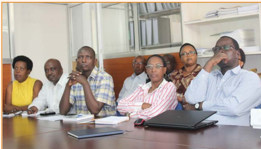
Le Staff UNFPA Burundi en train de suivre la présentation des stagiaires

Cette séance de présentation qui a été hautement appréciée et saluée par le staff de UNFPA a occasionné des échanges autour du travail accompli par ces nouveaux stagiaires. ça a été par ce fut une occasion pour le staff de UNFPA d'exprimer leur soutien et solidarité aux jeunes stagiaires afin de transformer leur idée en pratique.