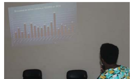
Les participants en train d'échanger sur la question de la Santé Sexuelle et Reproductive chez les adolescents et les Jeunes