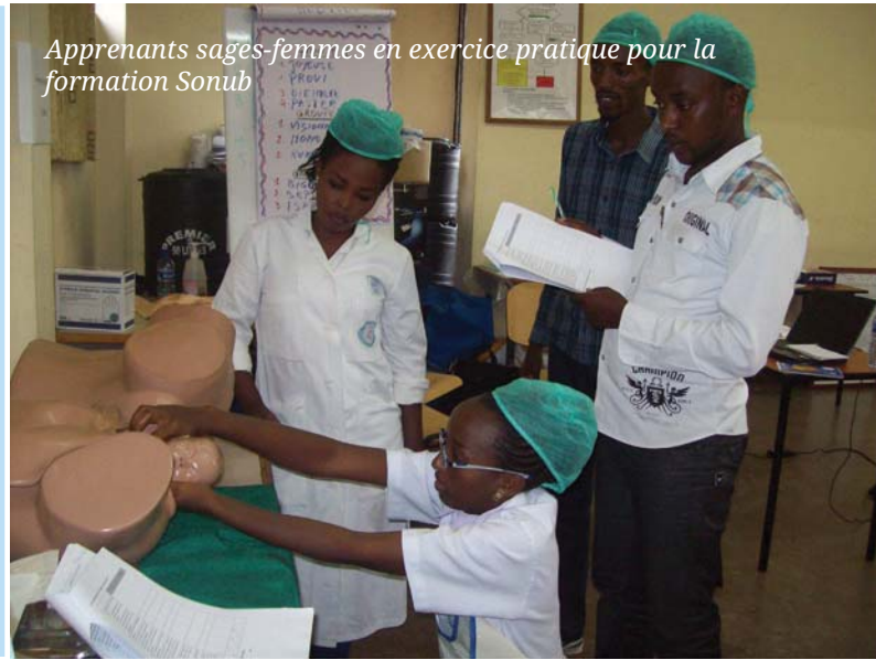
Apprenants sages-femmes en exercice pratique pour la formation Sonub

D u 15 au 27 Mai 2017, 19 apprenants sages-femmes de la 3ème année à l'Institut National de Santé Publique (INSP) ont bénéficié d'une formation en Soins Obstétricaux Néonataux