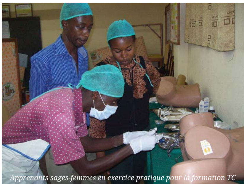
Apprenants sages-femmes en exercice pratique pour la formation TC

Ces apprenants sages-femmes ont acquis des compétences cliniques nécessaires pour offrir des services de planification de qualité et seront aussi aptes à prendre des décisions nécessaires pour gérer adéquatement les effets secondaires et les rumeurs relatifs à la contraception.