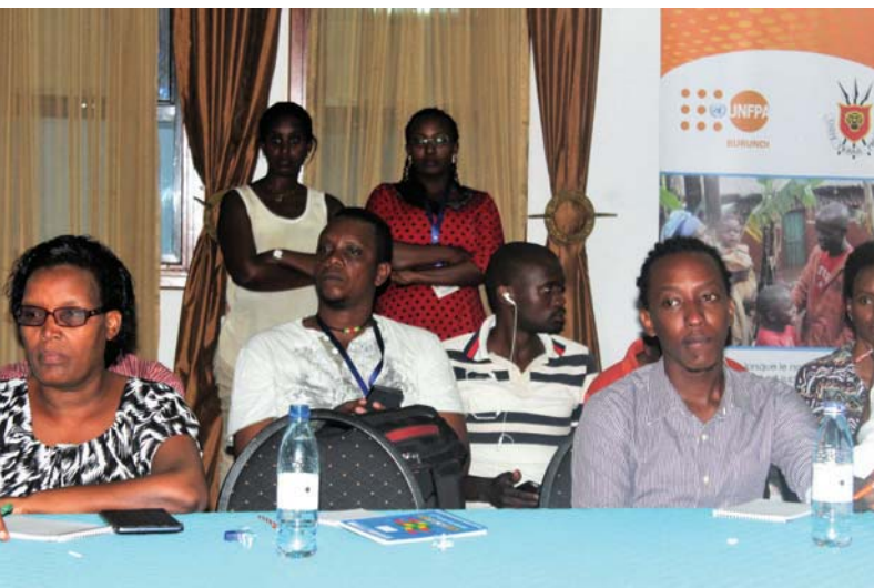
Participants à la conférence-débat

présents à cette conférence-débat qui avait pour thème: "Parler des Fistules = Sauver des Vies" Elle avait pour objectifs d'informer les participants sur la fistule obstétricale, tout en les invitant à briser le tabou autour de ce fléau à travers leur plume, leur micro, leur caméra, leur voix, leur danse, leur talent, leur imagination... pour éradiquer cette maladie et dire à tous qu'en plus d'être traitable et guérissable, elle est surtout évitable.