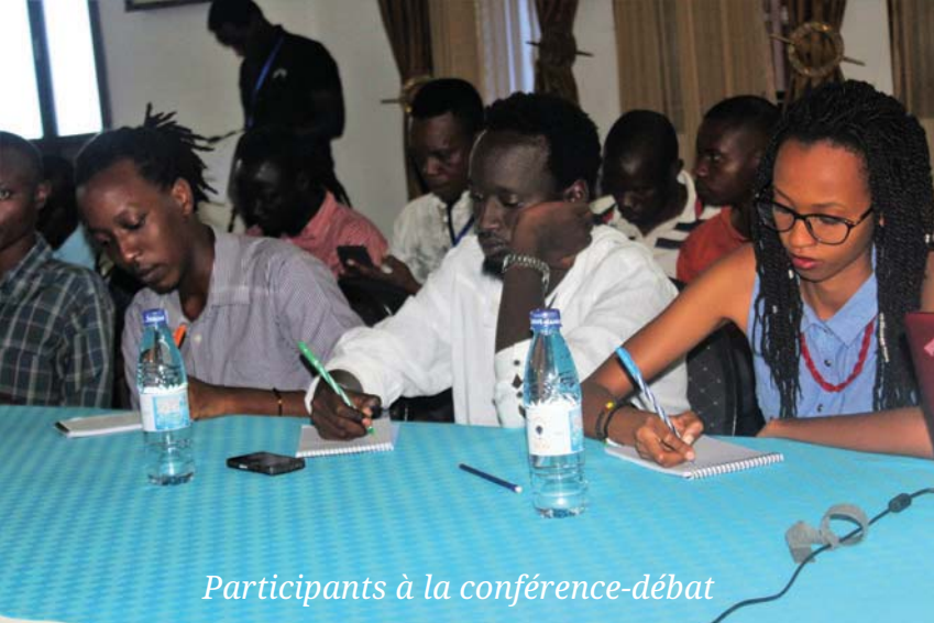
Participants à la conférence-débat

L e Mardi 23 Mai 2017, plus de 70 communicateurs et artistes d'horizons diverses ont été sensibilisés dans une conférence-débat sur la lutte contre les fistules obstétricales au Burundi par le Fonds des Nations Unies pour la Population (UNFPA). Cette conférence-débat est intervenue dans le cadre du Festival International de Cinéma et de l'Audiovisuel au Burundi (FESTICAB) dont la 9ème édition avait pour thème "le Cinéma et le droit de la femme". Ladite con-